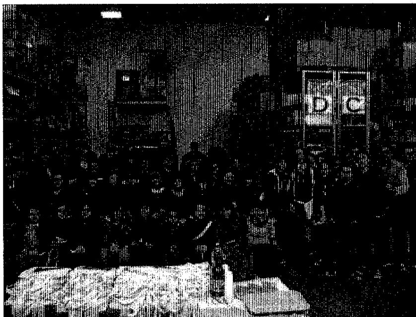
La visita a Sierra Europe

Quasi 400 studenti ferraresi hanno visitato gli stabilimenti delle aziende che hanno dato vita a Industriamoci