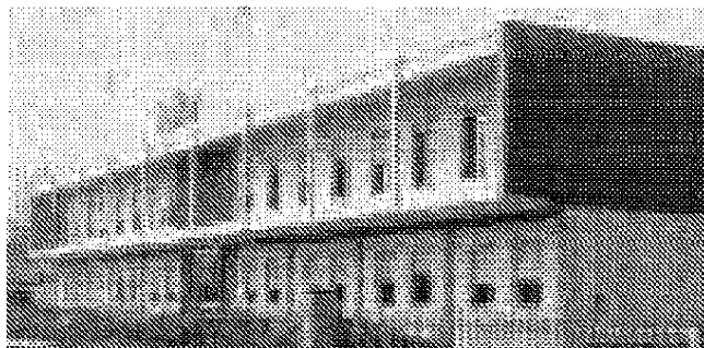
Anche Baltur apre le porte agli studenti

L'evento, esteso a tutto il territorio della provincia, intende offrire un'occasione di incontro e conoscenza diretta tra studenti, insegnanti e imprenditori, per spiegare quel valore che non sempre viene percepito attraverso i